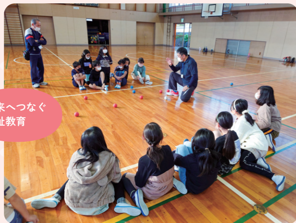
未来へつなぐ福祉教育

◆ 普通会員（1口）500円 ◆ 賛助会員（1口）1,000円 ◆ 法人会員（1口）3,000円