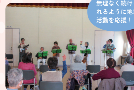
無理なく続けられるように地域活動を応援！

地域の様々なボランティア活動を応援するのはもちろん、ボランティアが来てほしい方々のコーディネートも実施！また様々な講座も開催しています。