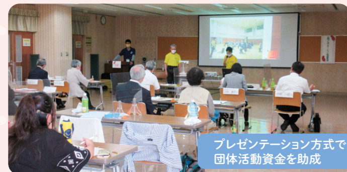
プレゼンテーション方式で団体活動資金を助成

町内の福祉団体への活動助成を通して「共助」のしきみを支えます。また、老人クラブや遺族会、障がい者団体（身障協会、にじいろの会、障がい者団体連絡会）の事務局として活動を支援しています。