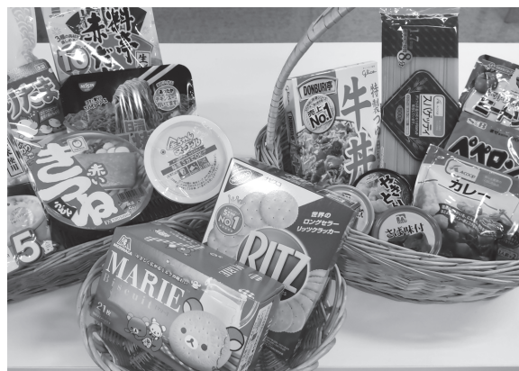
生活困窮世帯向けの食糧支援事業 「まんぷくボックス」の一例(サンプル)