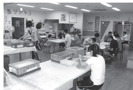
就労支援継続支援施設 B 型事業「たんぼぼ作業所」