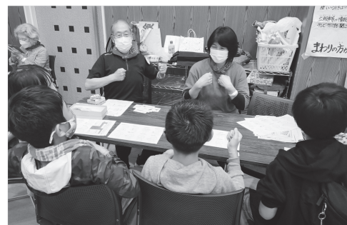
手話体験コーナー