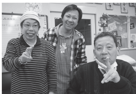
生活介護事業(デイサービス)「コスモスの家」