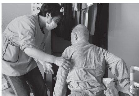
ヘルパー事業所(介護保険及び障がい福祉サービス)