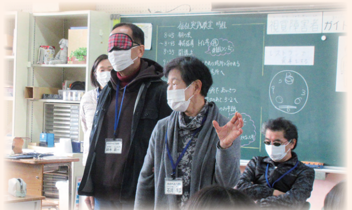
福祉実践教室でガイドヘルプ講座を担当

ボランティアで体も心も元気に! 交流が増え、仲間もできる! 自分の視野も広がるかも♪ 気付かなかった自分の才能にも出会う?