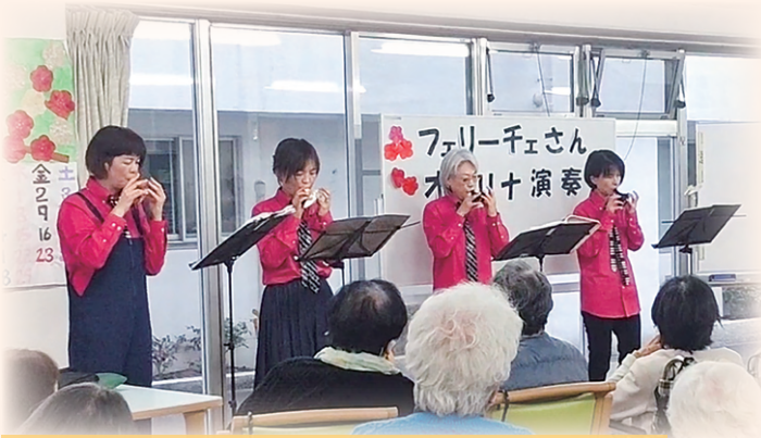
老人保健施設「和合の里」でオカリナ演奏