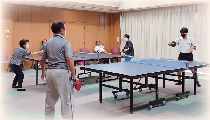
夏休みにボランティアを通して地域の人と交流