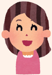
たんぼ作業所でボランティア中のTさん