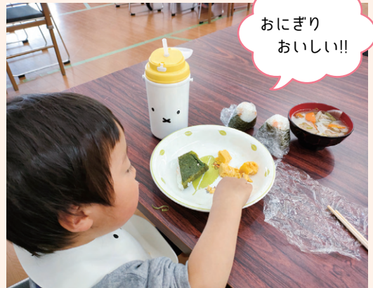
「子ども食堂おむすび東郷」へ玄米や調味料を提供しました。